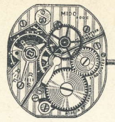
9''' T - 800 C seconde au centre (SC) center second (CS)